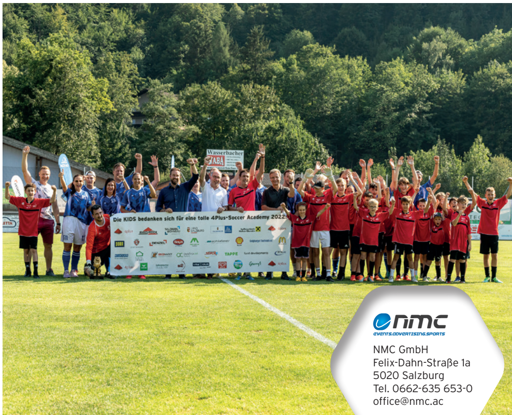
Druck und Satzfehler sind vorbehalten.

ANMELDESCHLUSS: 30. Juni 2023 - limitierte Teilnehmerzahl! www.socceracademy.at